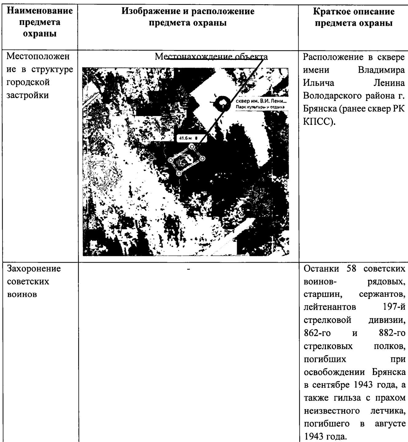
Таблица расположения предметов охраны объекта культурного наследия

Брянская область, г. Брянск, сквер РК КПСС